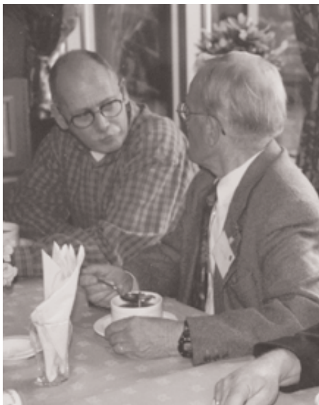
Kempermannen achter de bestuurstafel.