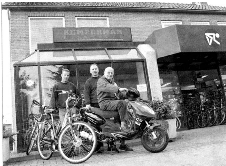
Kemperman Tweewielers introduceert nieuwe Keeway.