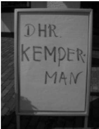
maar ook dames zijn welkom!

Het begint een traditie te worden dat Barbara uit Castricum het sfeerverslag van deze